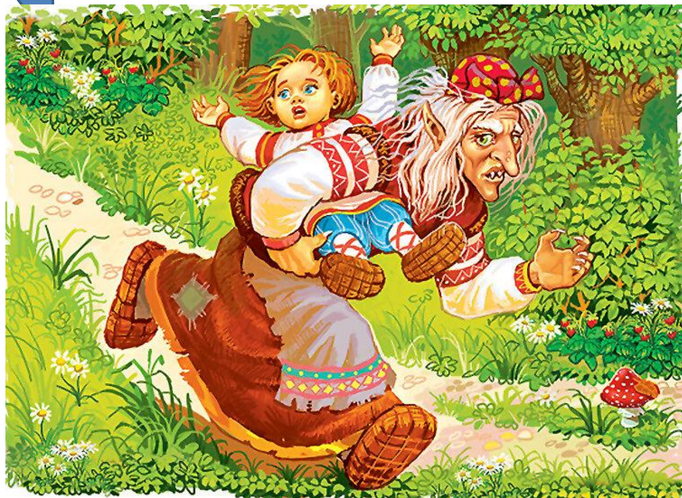
Баба-Яга уносит брatца Иванушку