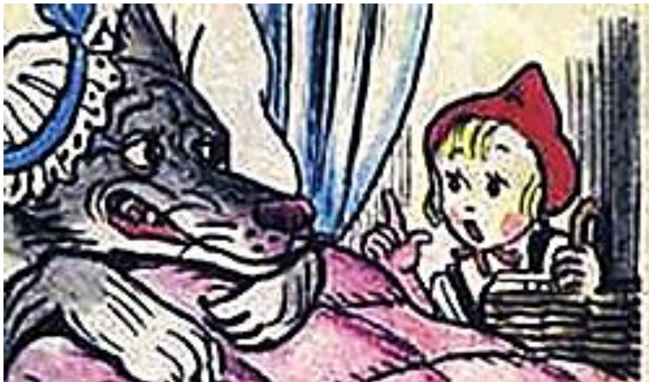
Волк съел бабушку