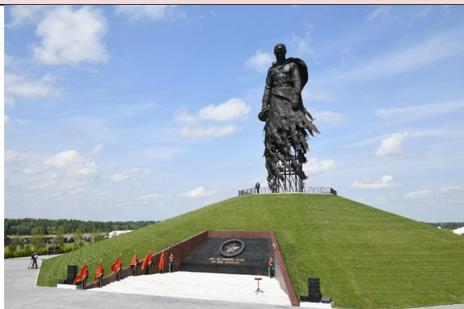
Мемориал, посвященный защитникам Ржева.