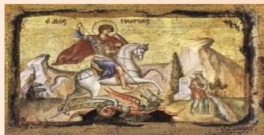
Святой Георгий Победоносец

9 декабря в современной России отмечается новая памятная дата – День Героев Отечества