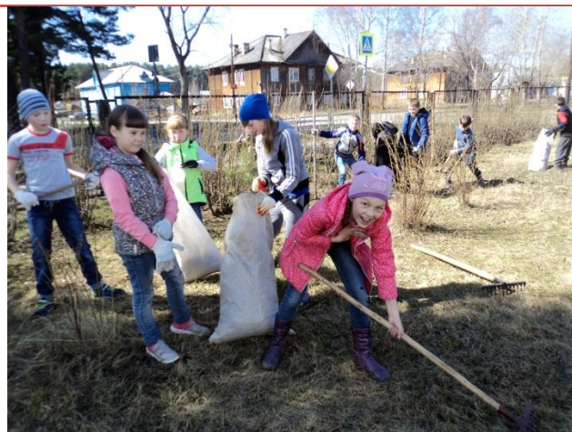
На фото – учащиеся 3б класса за работой на субботнике

По традиции, перед майскими праздниками, в школе проходит субботник. Вот и 26 апреля, в этот солнечный, теплый день все работники и учащиеся школы пришли с рабочим инвентарем и хорошим настроением. Субботник прошёл организованно, было вывезено около тонны мусора. Лучшим учащимся на линейке вручены благодарности за хорошую работу.