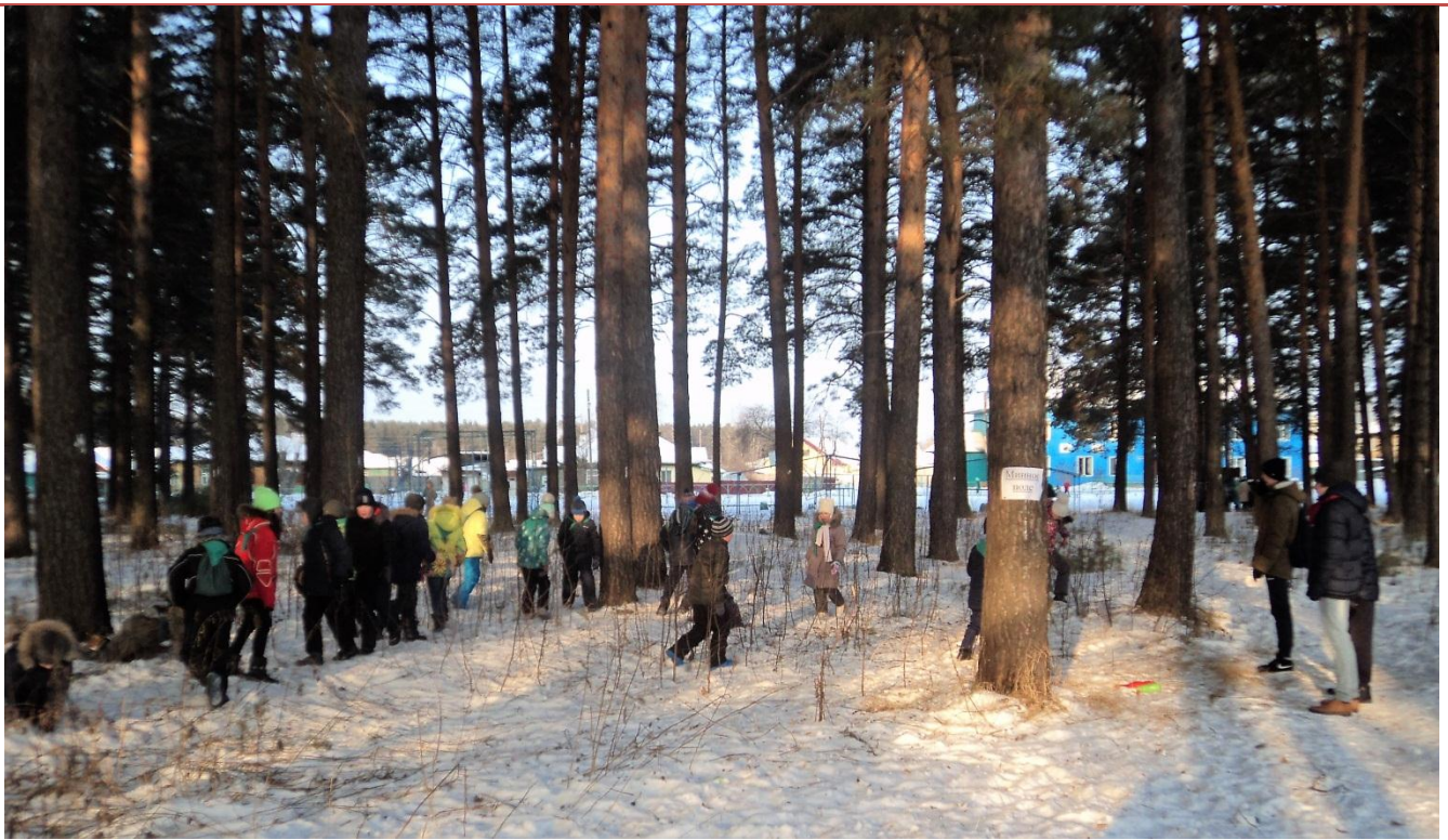
Станция «Минное поле»