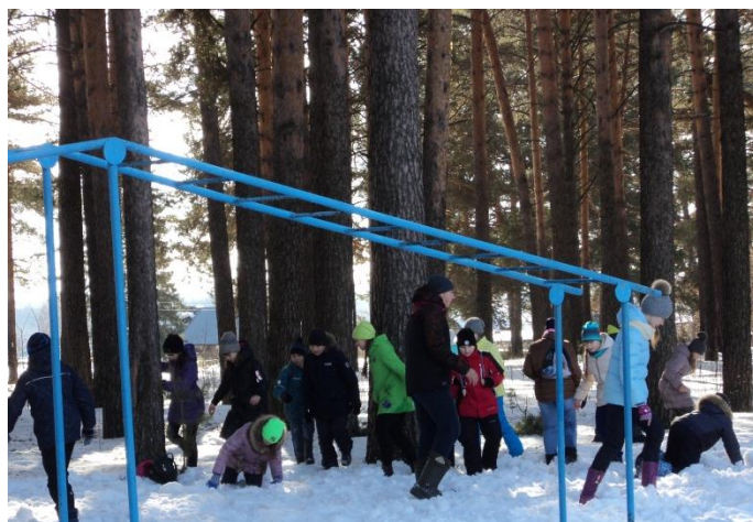
Станция «Минное поле»

После подведения итогов наш класс занял 1 место! УРА! Нам вручили приз – большой сладкий пирог, который мы съели с удовольствием.