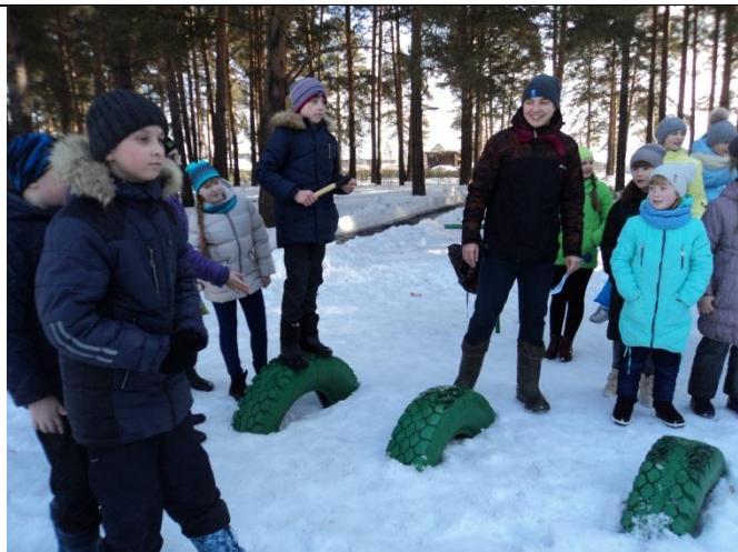
Станция «Останови танк противника» - бросание гранат.