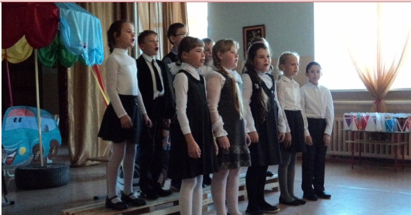
ХОР УЧАЩИХСЯ 4-х КЛАССОВ исполнили песню «Мы любим Вас, учителя».