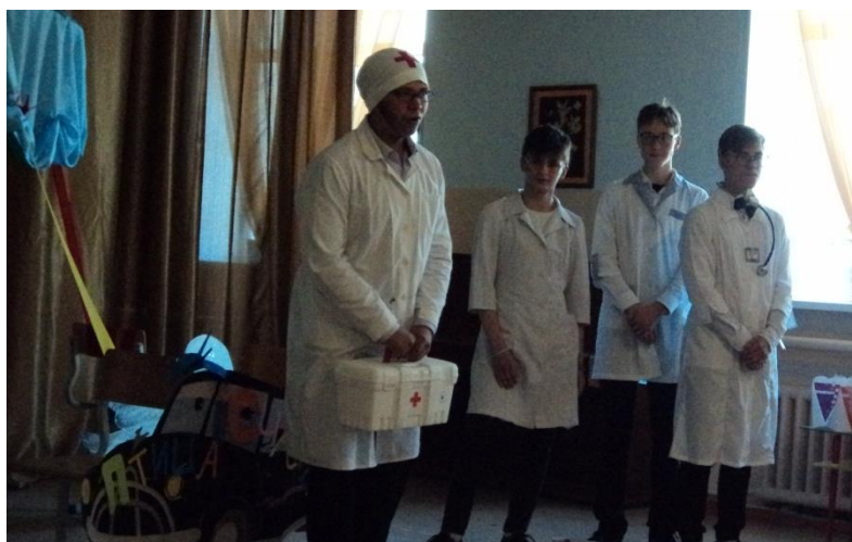
Учащиеся 9а класса – юмористическая сценка «Чтобы учителя всегда были здоровы».